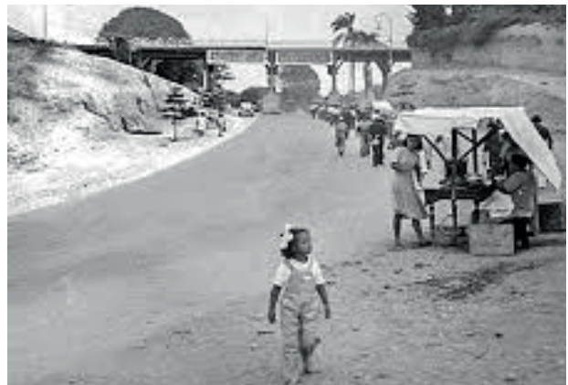
Antiguo puente Tenderini cuando aún era de madera. Este fue construido durante los primeros años del siglo XX, uniendo la Avenida Chorrillos con la Calle Lima

Finalmente, es importante destacar que un evento de esta magnitud e impacto solo es posible cuando se cuenta con el respaldo de los verdaderos líderes del mercado. Si bien nuestras convocatorias han sido un éxito rotundo, es fundamental seguir reforzando estas alianzas contando con la participación cada vez más activa de ambos sectores y sumando el valioso patrocinio de las empresas y gigantes de la industria más destacados. La presencia y el apoyo de estos líderes corporativos son cruciales, ya que contribuyen