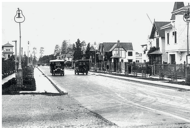
Antigua vista hacia la Av. Benavides desde Paseo de la República, Miraflores.

E n este contexto de búsqueda de soluciones, el ILIEV viene trabajando incansablemente desde hace 14 años para construir el futuro que todos merecemos, tanto para nosotros como para las próximas generaciones. Estamos convencidos de que este gran objetivo solo se alcanzará si el sector público y el sector privado trabajan verdaderamente de la mano. Visualizamos al sector privado como una gran locomotora, llena de energía e innovación, capaz de impulsar y dinamizar los engranajes del Estado para avanzar juntos hacia el progreso.