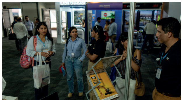
Arriba: Una de las conferencias realizadas en Piura. Abajo: visita de stand de las empresas aliadas en el convitran Piura - 2025.

tura eficiente no solo significa cemento y asfalto; significa mejorar la calidad de vida permitiendo un acceso rápido y oportuno a los centros de salud, garantizando que los estudiantes lleguen a sus centros educativos, y conectando de manera ágil los centros de producción agrícola e industrial con los grandes mercados de consumo. Todo esto, por supuesto, sin dejar de lado el enorme impulso que una buena conectividad le brinda a nuestro inmenso potencial turístico. Somos un país geográficamente privilegiado y, como bien nos recordaba el ilustre historiador Jorge Basadre: “El Perú es más grande que sus problemas”.