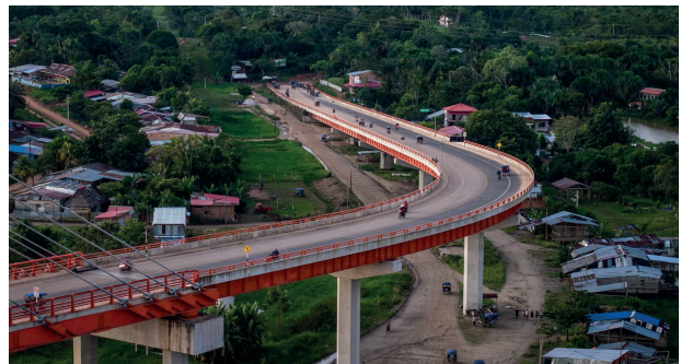
Lo que no debe suceder: El puente Nanay ubicado en Iquitos, Loreto, en la selva peruana, con una longitud de 2,300 metros, está terminado y no conecta con ninguna parte.