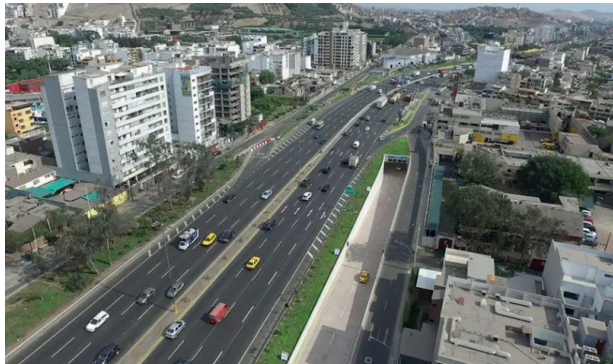
Actualmente la carretera Sur de Lima. 2026.

to, mediano y largo plazo, la infraestructura vial y los sistemas de transporte que nuestras comunidades exigen para consolidar su crecimiento económico y bienestar social.