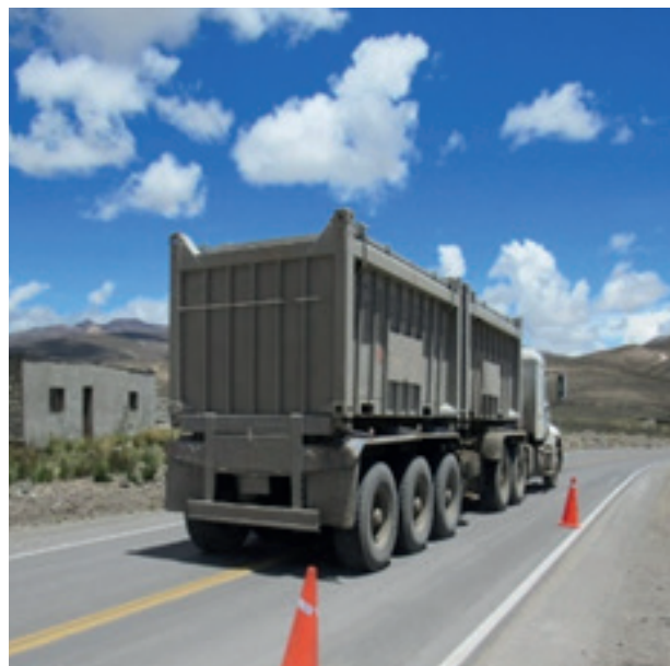
Vehículos T3S3, con neumáticos de banda ancha, transporte de carga pesada.

Este marco legal ha fomentado el uso masivo de neumáticos de 425 mm a 455 mm. No obstante, la investigación internacional, como la del Departamento de Transporte de Florida (FDOT) y de ILLINOIS, indica que la primera generación de estos neumáticos aumentó significativamente los esfuerzos de contacto, provocando daños superiores a los previstos en los modelos de diseño tradicionales.