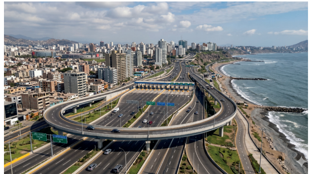
Diseñando nuestro futuro en el Perú.