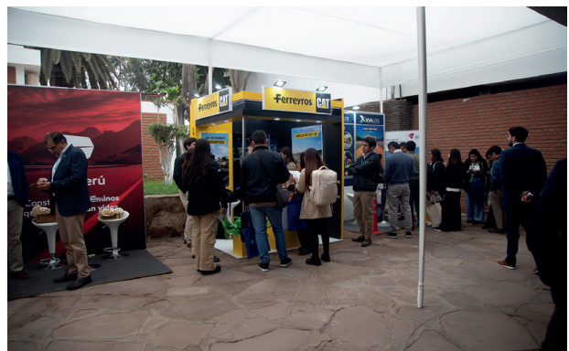
Arriba: Una de las conferencias realizadas en Ica. Abajo: visita de stand de las empresas aliadas en el convitran Ica - 2025.