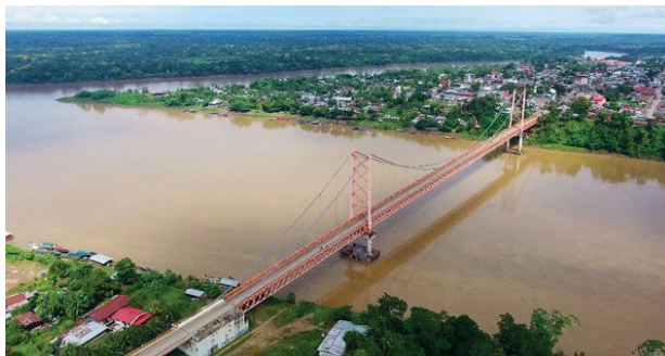
El Puente Guillermo Billinghurst , con una estructura colgante de 722.95 metros de largo situada en Puerto Maldonado, Madre de Dios.